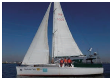
協力艇：サザンクロス号 (40ft)

セーリングヨット サザンクロス号に菰樽を積んで江戸に向かいます！ ぜひ お誘いあわせの上、お見送りいただけますようお願いいたします。