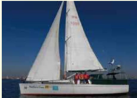
協力艇：サザンクロス号（40ft）